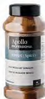
NOIX DE MUSCADE MOULUE Poids : 450 g