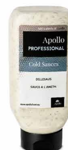
SAUCE À L'ANETH 670 ml