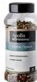
POIVRE QUATRE SAISONS Poids : 400 g