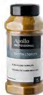
CUMIN MOULU Poids : 410 g