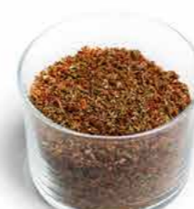
ÉPICES POUR STEAK AMÉRICAIN Poids : 300 g