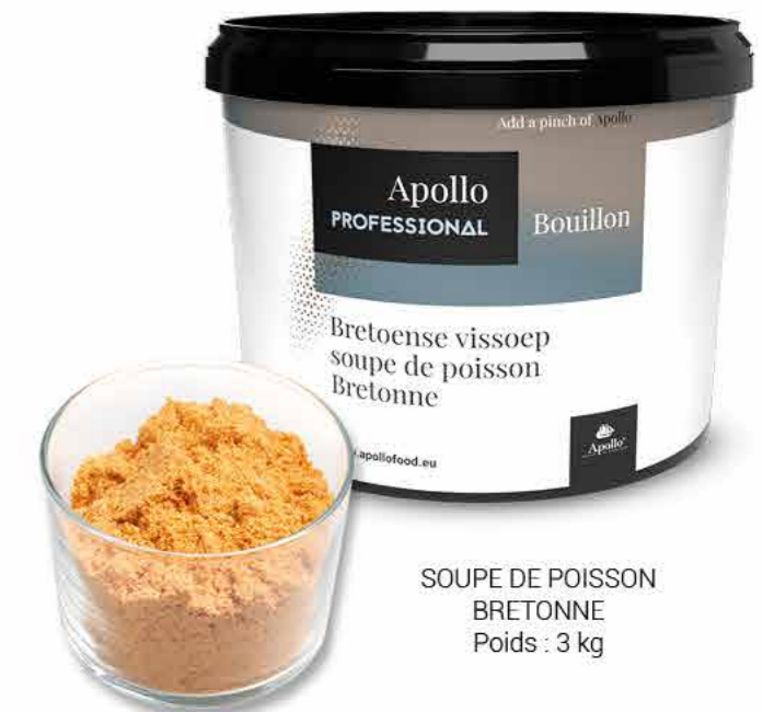
SOUPE DE POISSON BRETONNE Poids : 3 kg