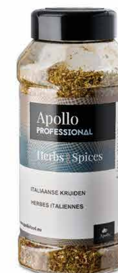
ÉPICES ITALIENNES Poids : 175 g