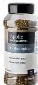
POIVRE NOIR STEAK Poids : 400 g