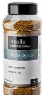
POIVRE AIL Poids : 600 g