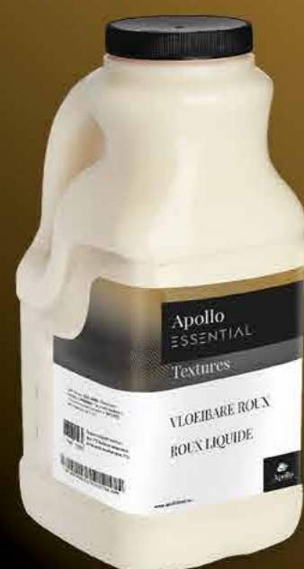
APOLLO ROUX LIQUIDE 2.12l