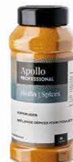
ÉPICES POULET Poids : 750 g