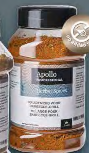
MELANGE POUR BARBECUE-GRILL Poids : 270 g