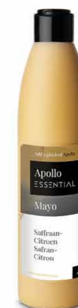
MAYO SAFRAN CITRON 250 ml