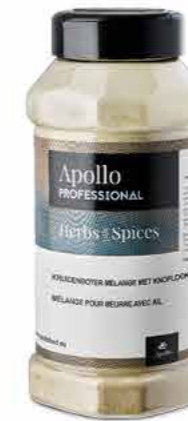
MÉLANGE BEURRE AUX FINES HERBES Poids : 500 g