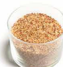
MIX POIVRE & SEL Poids : 800 g