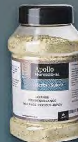
MELANGE D'ÉPICES JAPONAIS Poids : 330 g