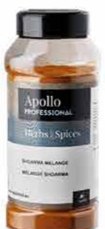
MÉLANGE SHOARMA Poids : 550 g