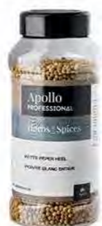
POIVRE BLANC GRAIN Poids : 500 kg