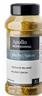
MÉLANGE TOSCAN Poids : 500 g