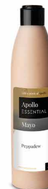
MAYO PEPPADEW 250 ml