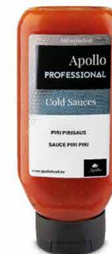
SAUCE PIRI PIRI 670 ml