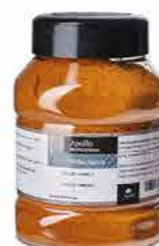
RAS EL HANOUT Poids : 220 g