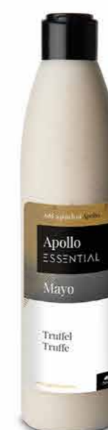
MAYO TRUFFE 250 ml