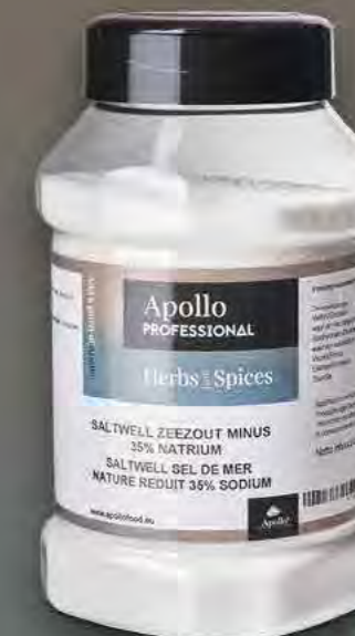
SALTWELL SEL DE MER Poids : 500 g

La combinaison des minéraux naturellement présents dans Saltwell confère à Saltwell un goût de sel doux qui est très similaire à celui du sel de table. La teneur en sodium du sel naturellement extrait de Saltwell est 35 % plus faible que celle du sel de table naturellement extrait.