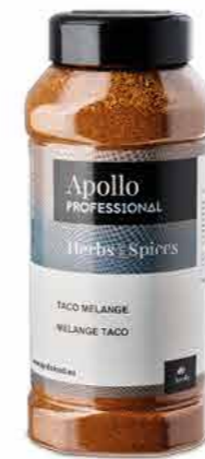
MÉLANGE TACOS Poids : 550 g