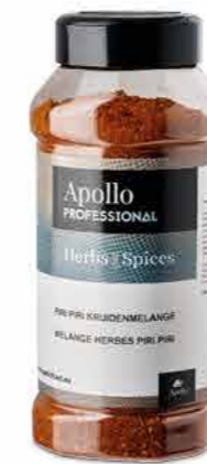
MÉLANGE D'ÉPICES PIRI-PIRI Poids : 375 g