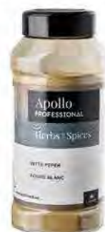
POIVRE BLANC MOULU Poids : 435 g