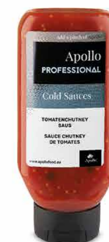
SAUCE CHUTNEY DE TOMATES 670 ml