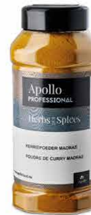
MÉLANGE CURRY MADRAS Poids : 450 g