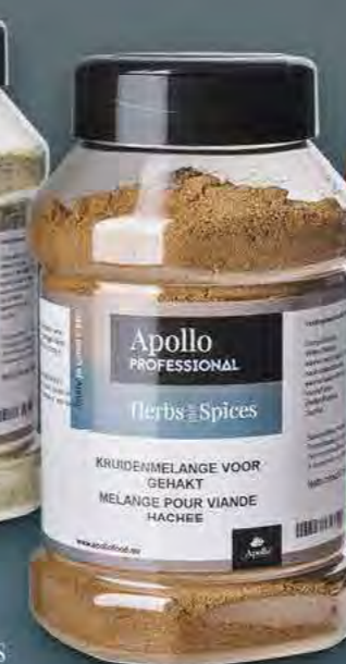
MELANGE POUR VIANDE HACHÉE Poids : 280 g