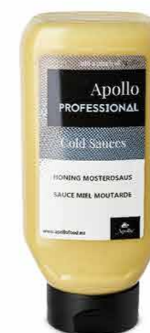
SAUCE MIEL MOUTARDE 670 ml