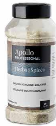
MÉLANGE D'ÉPICES BOURGUIGNONNE Poids : 500g