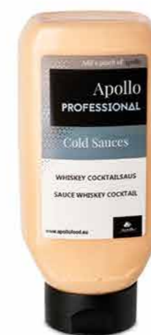
SAUCE WHISKEY COCKTAIL 670 ml