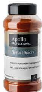
PULLED PORC/BOEUF/POULET Poids : 650 g