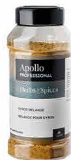
MÉLANGE GYROS Poids : 500 g