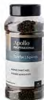
POIVRE NOIR ENTIER Poids : 450 g