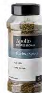
THYM ENTIER Poids : 130 g