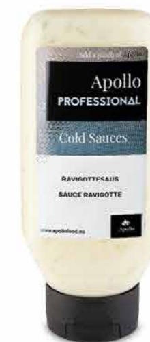
SAUCE RAVIGOTTE 670 ml