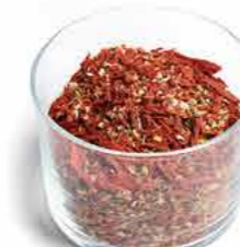
MIX BRUSCHETTA Poids : 350 g