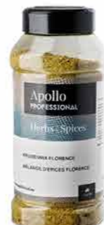
MELANGE D'ÉPICES FLORENCE Poids : 550 g