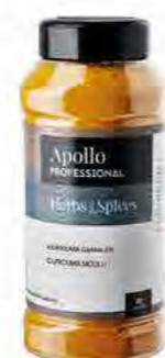
CURCUMA MOULU Poids : 400 g