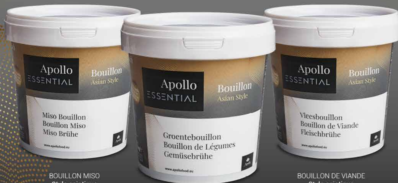
BOUILLON MISO Style asiatique Poids : 1 kg