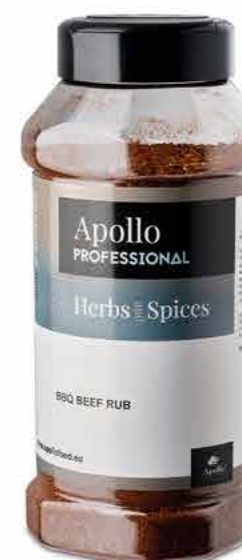
ÉPICES POUR BBQ DE BOEUF Poids : 580 g