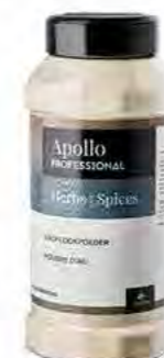
AIL EN POUFRE Poids : 360 g