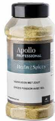
MÉLANGE D'ÉPICES POISSON Poids : 550 g