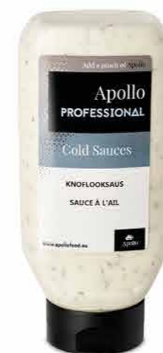
SAUCE À L'AIL 670 ml