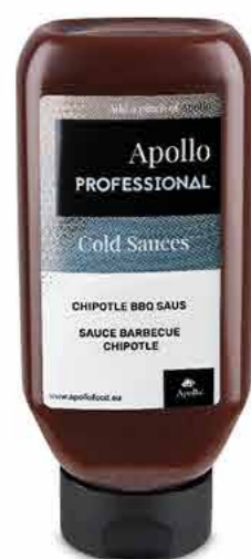
SAUCE BBQ CHIPOTLE 670 ml