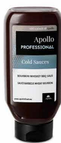
SAUCE BBQ BOURBON WHISKY 670 ml