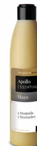
MAYO 3 MOUTARDES 250 ml