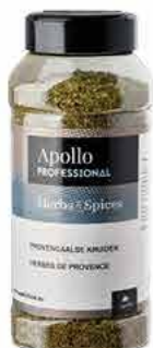
MÉLANGE PROVENÇAL Poids : 130 g