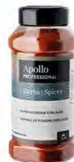
PAPRIKA EDELSUSS Poids : 450 g