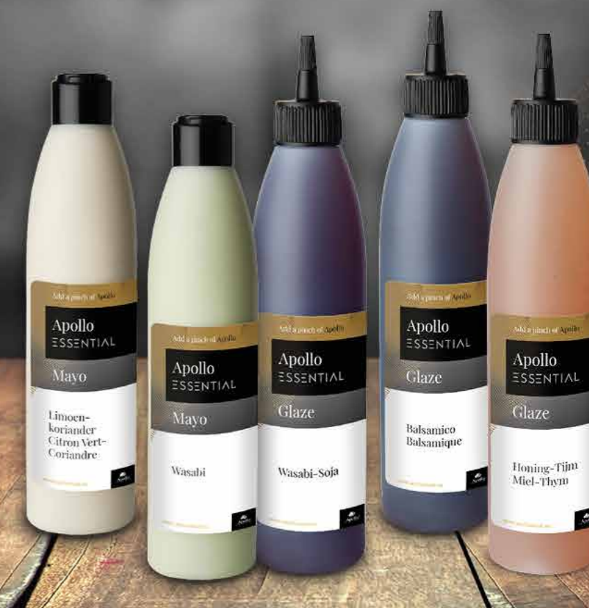
MAYO CITRON VERT-CORIANDRE 250 ml