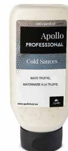
MAYO À LA TRUFFE 670 ml