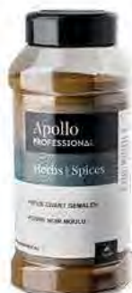
POIVRE NOIR MOULU Poids : 460 g