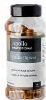
BÂTONS DE CANNELLE CEYLAN Poids : 150 g