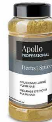
MÉLANGE D'ÉPICES NASI Poids : 575 g