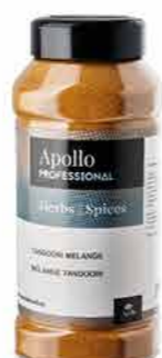
MELANGE POUR TANDOORI Poids : 500 g