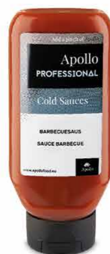
SAUCE BARBECUE 670 ml