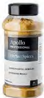
RACINE DE GINGEMBRE MOULUE Poids : 300 g