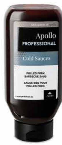
SAUCE BBQ PULLED PORK 670 ml