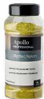
DIPPER ITALIEN AVEC FROMAGE Poids : 500 g