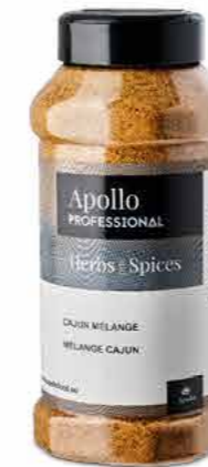
MÉLANGE D'ÉPICES CAJUN Poids : 700 g